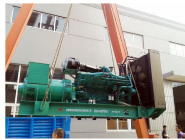
出口巴基斯坦 1200KW康明斯发电机组