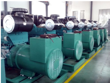
东南亚客户6台康明斯发电机组并机