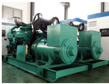
出口伊朗 1600KW康明斯发电机组