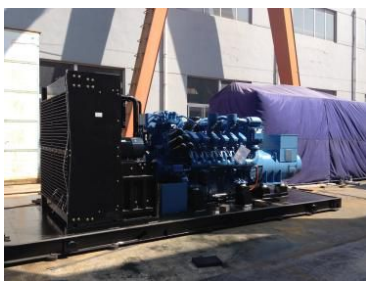
西藏机场 1200KW MTU静音发电机