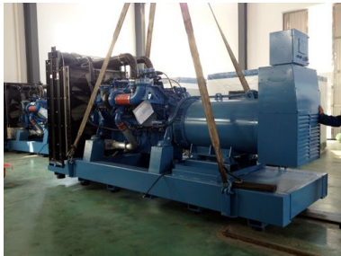
东南亚客户 2台600KW MTU发电机组