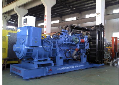
出口巴基斯坦 800KW MTU发电机组